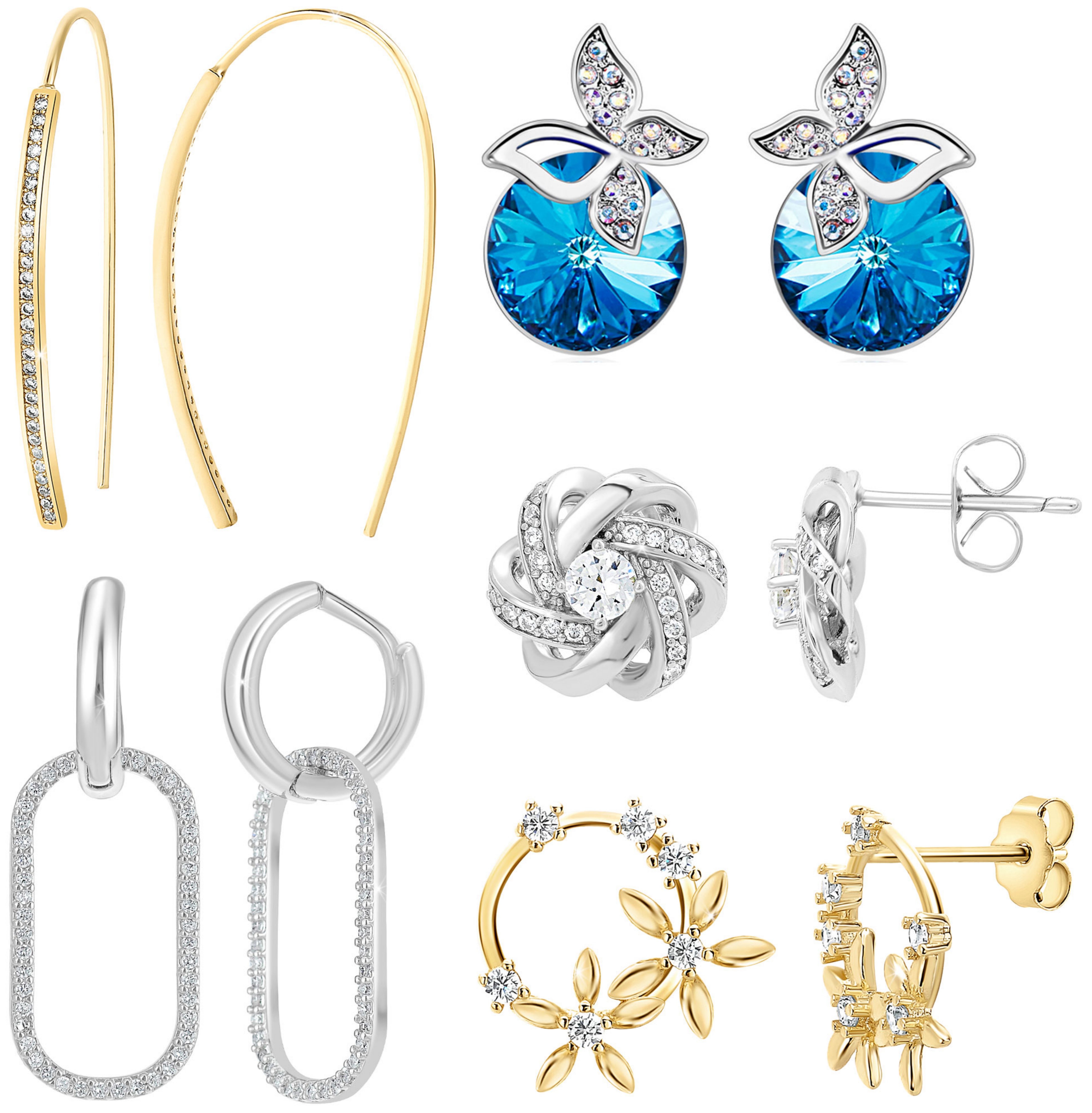
Précision des moindres détails